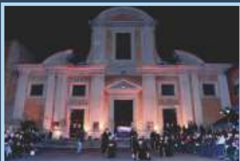
2016 ROMA S. Francesco a Ripa