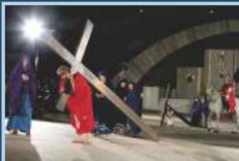
2013 S. Giovanni Rotondo