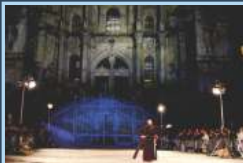
2010 Santiago de Compostela