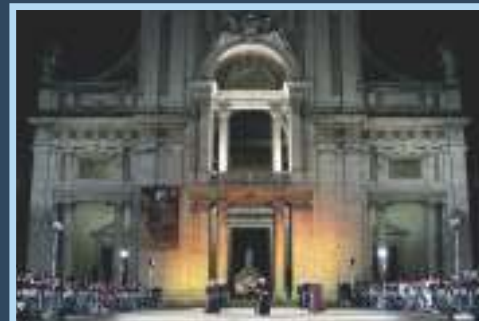
2011 S. Maria degli Angeli - Assisi