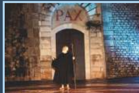
2014 Abbazia di Montecassino